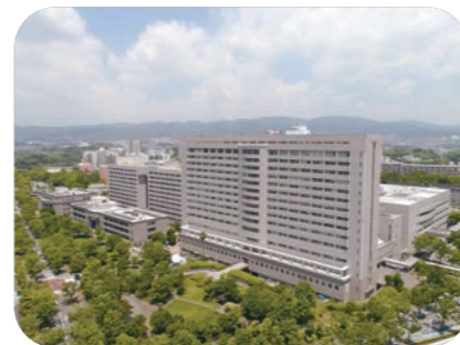
大阪大学医学部附属病院