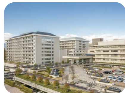
京都大学医学部附属病院