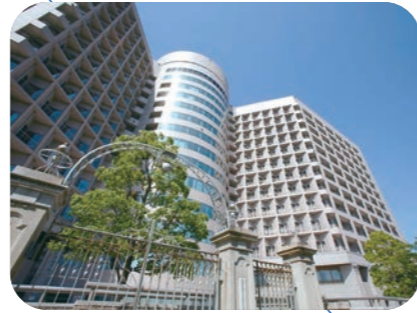
名古屋大学医学部附属病院