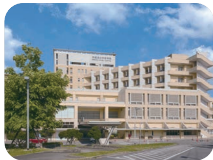
沖縄県立中部病院